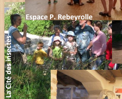
La Cité des insectes