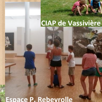
Espace P. Rebeyrolle