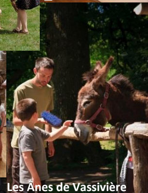
Les Anes de Vassivière