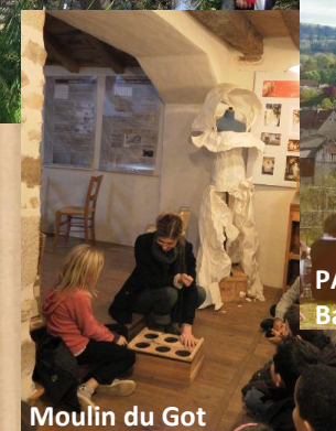
Moulin du Got