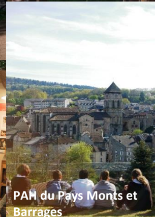
PAM du Pays Monts et Barrages